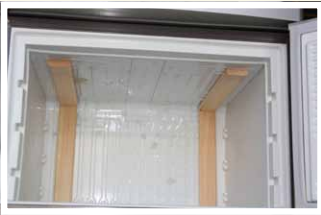
Befestigung der Holzlatten für die Heizfolie im Schrank . . .