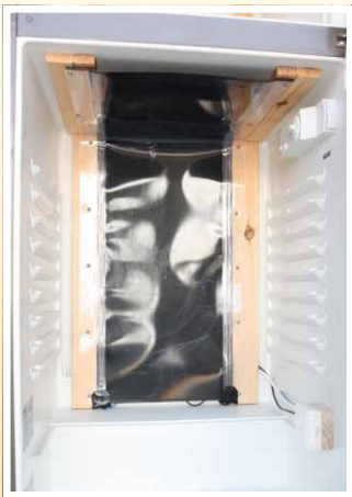
Aufbringen der Heizfolie auf die Befestigungslatten . . .