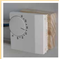
Anbringen des Thermostats und Anschluss der Elektroleitungen . . .

Die FE-Folie wird an den hellen Seitenrändern am Gehäuse festgeschraubt und kann mit einer Edelstahl- oder Kunststoffplatte abgedeckt werden.